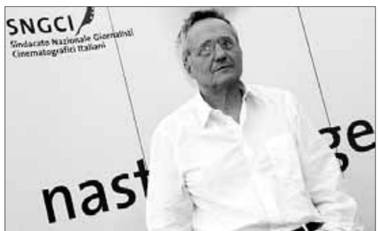
Il regista piacentino Marco Bellocchio alla cerimonia per i Nastri d'argento

Il regista piacentino Marco Bellocchio , sul finire della cerimonia di consegna dei Nastri d'argento, che ha ricevuto per il miglior soggetto del film Il regista di matrimoni , ha acceso un pizzico di polemica. Prima ha ricordato come il ritmo della serata era