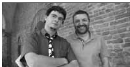
Alcuni autori presenti ieri a Castellarquato, che sono stati protagonisti dell'incontro con il pubblico